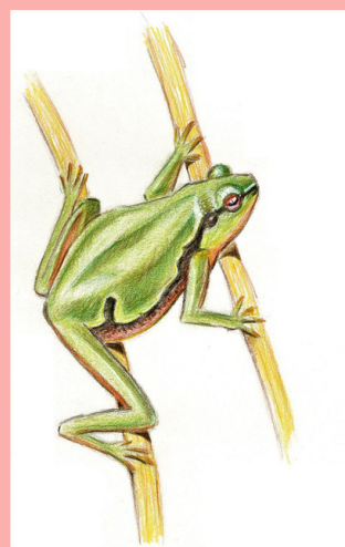
Rainette verte - aquarelle @ Arbo

La Rainette verte ( Hyla arborea ) est la plus petite des grenouilles et pourtant, c'est elle qui coasse le plus fort ! Elle a une peau lisse d'un vert très vif. Elle porte une ligne noire du museau jusqu'au pattes arrières qui lui fait comme un long bandeau de pirate. Les ventouses au bout de ses doigts lui permettent de grimper dans les arbres ou dans la végétation des milieux humides comme les joncs.