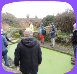
Des travaux de maçonnerie devront être envisagés sur le lavoir de Mesgouez - Porspoder@MH

Afin d'échanger sur ces nouvelles pratiques, 4 représentants de l'association "Lavoirs et fontaines" de Plaintel sont venus rencontrer le groupe de travail constitué dans le cadre de l'ABC de Porspoder. Les discussions très riches ont porté sur la végétation des lavoirs (utile aux insectes !), sur les travaux de maçonnerie à prévoir (pour conserver le caractère historique mais aussi assurer la fonctionnalité de ces bassins, indispensable au cycle de vie des amphibiens !) et enfin sur la nécessaire sensibilisation des habitants à ces changements d'usage. La commune de Porspoder est sollicitée pour participer à un groupe de travail régional sur le sujet et apporter son retour d'expérience !