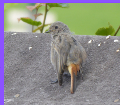
Rouge queue noir - jardin - Porspoder

Le Rougequeue noir ( Phoenicurus ochruros ), appelé aussi Rossignol des murailles, apprécie les sites rocheux ou bâtis avec peu d'arbres. Peu farouche, il aime se percher pour guetter les insectes volants mais il apprécie aussi les araignées des jardins ou les puces de mer de la plage de Melon ou du Bourg. S'il est un passereau relativement commun, il est cependant assez rare de le croiser à Porspoder.