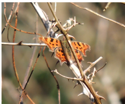
Robert-le-Diable - Saint-Dénec - Porspoder

Quel étrange nom pour un papillon, inspiré d'un roman populaire daté du 13ème siècle ! Le Robert-le-Diable ( Polygonia c-album ) est bien reconnaissable à ses ailes découpées "à la diable" et à leur couleur fauve.