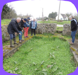
La végétation du lavoir de Kervézennoc se développe car l'apport en eau est devenu insuffisant Porspoder@MH