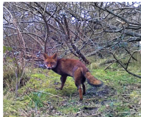
Renard roux - Porspoder

La rencontre avec le Renard roux ( Vulpes vulpes ) est toujours fascinante et l'on ne sait pas, qui de l'un ou de l'autre, est le plus surpris. Son pelage roux, marqué de blanc sous le ventre et la gorge, tire parfois vers le noir lui donnant un air charbonnier. Sa longue queue fournie contraste avec la finesse de son museau. Cousin du chien, il se nourrit de petits rongeurs (mulots, rats, souris...) et est pour cela un allié précieux des agriculteurs. Il mange aussi des fruits sauvages, des amphibiens ou des oiseaux. Il semble être bien présent sur Porspoder même si ses effectifs varient beaucoup selon les maladies (galles) qui l'atteignent périodiquement. Des