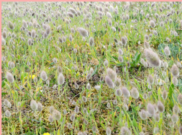
Queues de lièvre - Dunes des Colons - Porspoder

Dressée sur les dunes des colons et plus largement en bord de mer, la Lagure ovale ( Lagurus ovatus ) arbore une fleur aux poils "laineux" qui lui vaut son surnom de "queue de lièvre". Il n'est pas rare de croiser sur sa tige un Azuré commun, petit papillon bleu venu s'y reposer ! Sa présence est le signe d'un ancien piétinement du sol et, comme la ravenelle, c'est une plante qui profite de terres riches en sels nutritifs. Ses racines contribuent à fixer le sable. Le vent, quant à lui, est chargé de disperser les graines qui perlent à la fin de sa floraison.