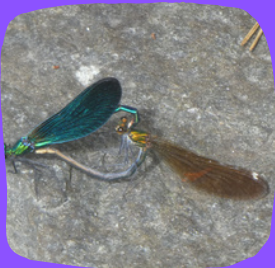
Les demoiselles, ici un couple de Caloptéryx élégants, utilisent la végétation des lavoirs pour pondre.