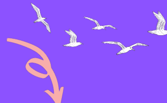
Nid d'Hirondelle de rivage - Plage du Bourg - Porspoder