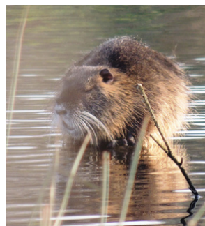
Ragondin- Saint-Dénec - Porspoder