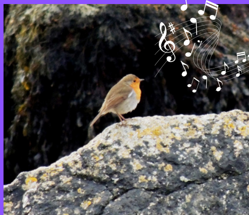
Rougegorge familier - Presqu'île Saint-Laurent - Porspoder @MH

On a coutume de dire que le Rougegorge familier ( Erithacus rubecula ) est l'ami du jardinier car il attend, un peu à l'écart mais sûr de son dû, les lombrics et les insectes découverts par la bêche. Il est aussi un admirable chanteur, aux mélodies chaque fois renouvelées, alternant strophes graves et envolées sopranes, qui transforment les jardins et les haies en scènes d'opéras lyriques.