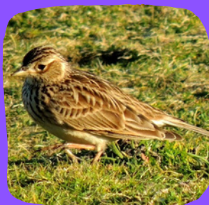
Alouette des champs - dunes des Colons - Porspoder