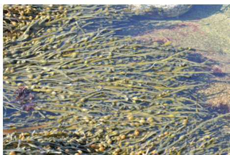
Ascophyllum nodosum - Mazou - Porspoder

Appelé aussi "Robert" mais mieux connu sous le nom de "goémon noir", l' Ascophyllum nodosum est une algue brune qui forme de longues lanières lisses. A marée basse, celles-ci s'étalent comme des cheveux sur les rochers et à marée haute, soulevées par leurs flotteurs, elles dansent au rythme des flots. L' Ascophyllum se mêle volontiers au fucus vésiculeux et partage avec lui les coins abrités. La Littorine obtuse fait son repas des microalgues présentes à sa surface.