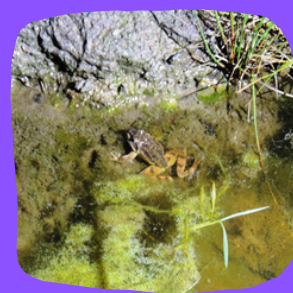
Grenouille agile - Saint-Dénec - Porspoder