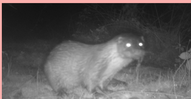
Loutre d'Europe - février 2023 - étang du Spernoc - Porspoder@Arbo

Il est des espèces toujours un peu emblématiques sur un territoire. La Loutre d'Europe est de celles-là. Contrairement à l'Aber Ildut où elle est présente, Porspoder ne semblait pas présenter toutes les caractéristiques propres à son accueil : ses ruisseaux sont étroits et peu poissonneux. C'était sans compter sur les amphibiens, et notamment les Crapauds épineux qui, en janvier-février, à la saison des amours, viennent en grand nombre pondre dans les mares. Voilà une orgie bien à propos pour les Hérons cendrés , les Putois d'Europe et autres mammifères ... C'est alors que, près d'un étang aux sources du ruisseau du Spernoc, la Loutre s'invite au festin ! Longtemps chassée puis affaiblie par les pollutions des cours d'eau , elle est aujourd'hui protégée au niveau français et européen et reconquiert doucement ses anciens territoires perdus. Le maintien en bon état des zones humides et boisées est donc indispensable à sa survie comme à celle de nombreux autres animaux. Chaque petit morceau de territoire compte et recèle bien plus de formes de vies que ce qu'un regard rapide pourrait nous suggérer. Symbole de la reconquête de la biodiversité, la Loutre intègre dorénavant le patrimoine de Porspoder !