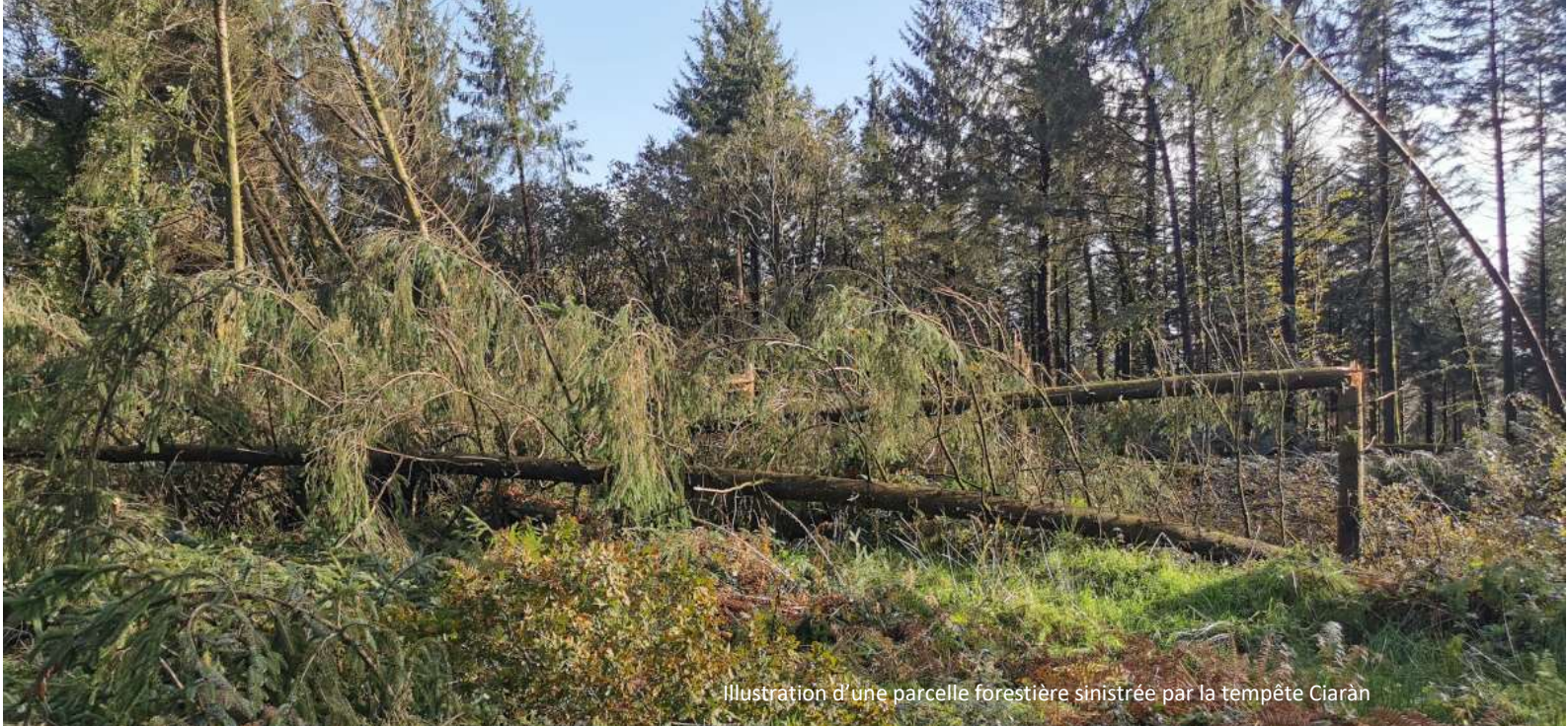
Illustration d'une parcelle forestière sinistrée par la tempête Ciaràn